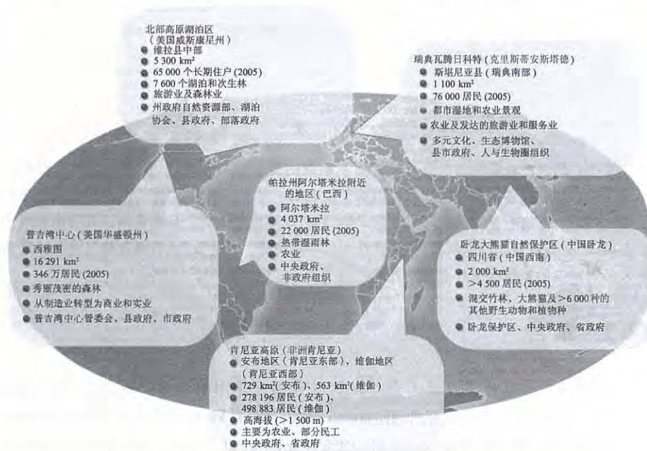
图 12.1 6 个人类-自然耦合系统案例的地理位置和主要特性 (地点、空间范围、人口、生态、经济、行政属性)

地区(阿尔塔米拉)、瑞典克里斯蒂安斯塔德的瓦腾日科特(瓦腾日科特)(图12.1)。这些地区包括市区(普吉湾)、郊区(瓦腾日科特)以及农村(阿尔塔米拉、肯尼亚、威斯康星、卧龙),位于发达国家的有普吉湾、威斯康星和瓦腾日科特,发展中国家的有阿尔塔米拉、肯尼亚和卧龙。这些地区的生态、社会经济、政治、人口和文化背景是不同的,它们包含了各种类型的生态系统服务和环境问题(附表A见 www.sciencemag.org/cgi/content/full/317/5844/1513/DC1 )。